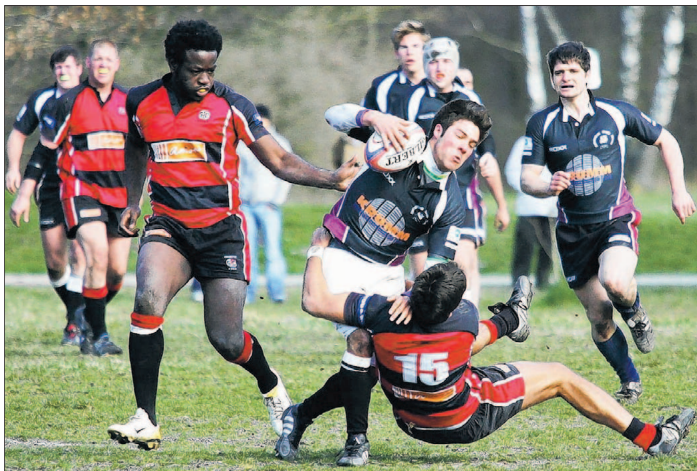
Frankfurter Kampfkraft: Das Team der Studentenstadt (dunkle Trikots) konnte eine 7:0-Führung nicht behaupten.